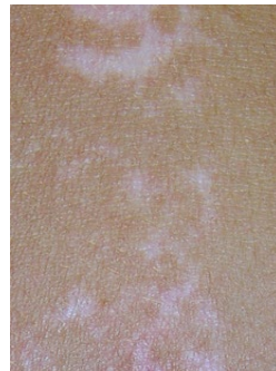
nach 10 x Excimer-Laser

Die Pigmentzelltransplantation (PTX) ist ein innovatives Behandlungsverfahren bei stabiler Vitiligo. Die PTX beruht auf einer in Australien erlernten und in Deutschland durch Professor Amon weiterentwickelten Methode.