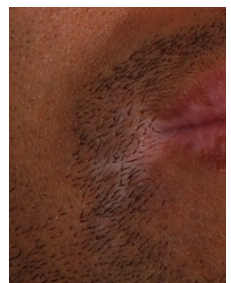
6 Monate nach PTX